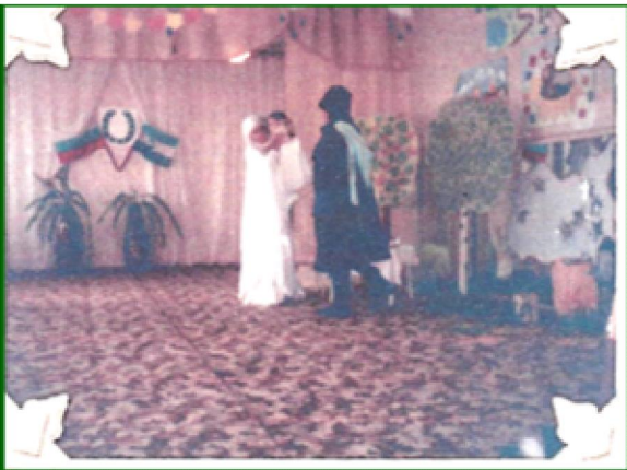
«День Матери» Традиции, обряды