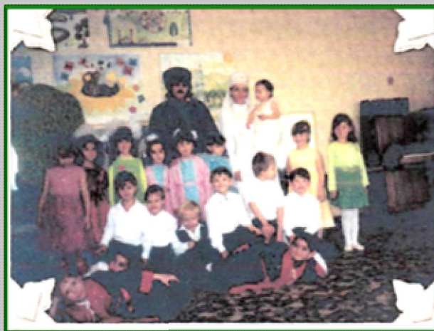
«Первый шаг ребенка» (Кабардинский обряд)