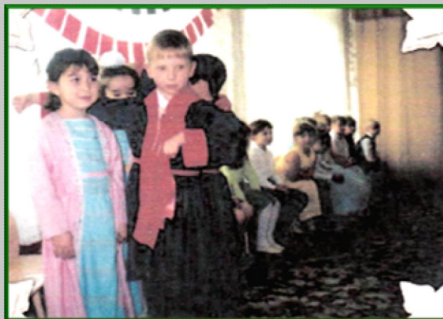
«Сказки седого Эльбруса»